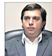
GABRIEL ALPEROVICH el hijo del ex gobernador fue mencionado como participante de la fiesta donde murió.