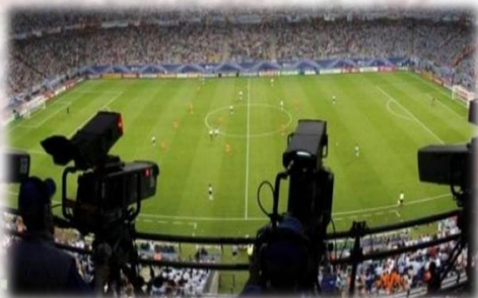
Derechos de Televisación/Sponsor TV/estadio/medios