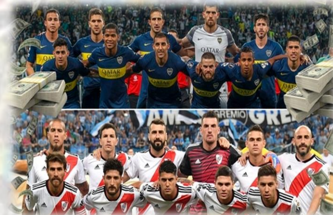
Planteles de Equipos